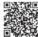
二次元バーコード